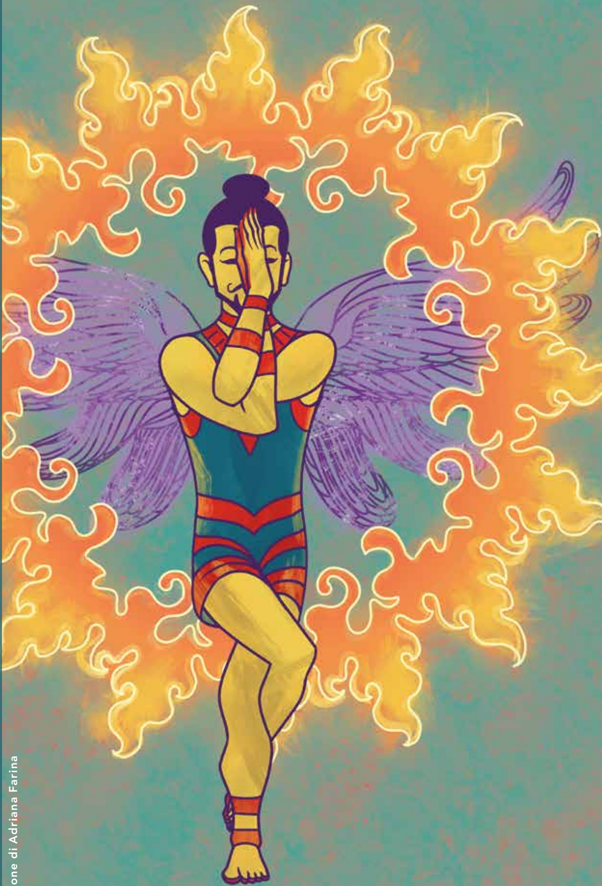
Illustrazione di Adriana Farina